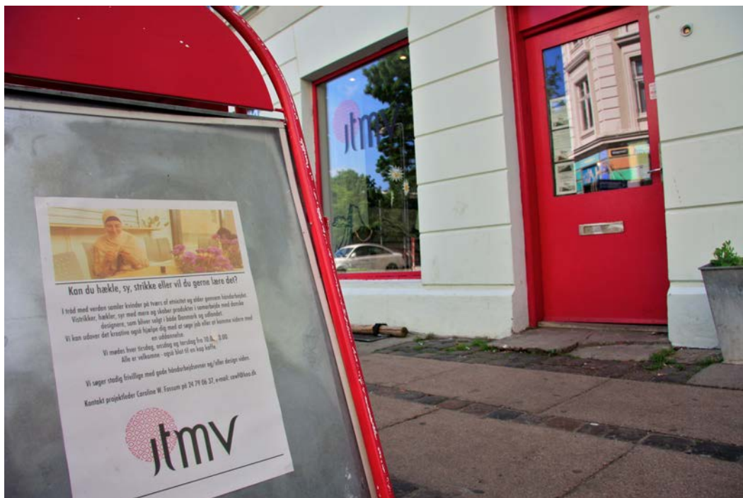
( http://www.mariesideer.dk/wp-content/uploads/2014/02/IMG_7302.jpg )Butikken i Saxogade