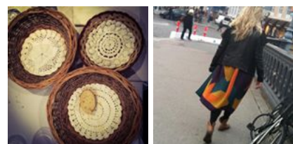
( https://www.instagram.com/p/BCcRNo1QST6/ ) ( https://www.instagram.com/p/BCXBkRnQSZp/ )