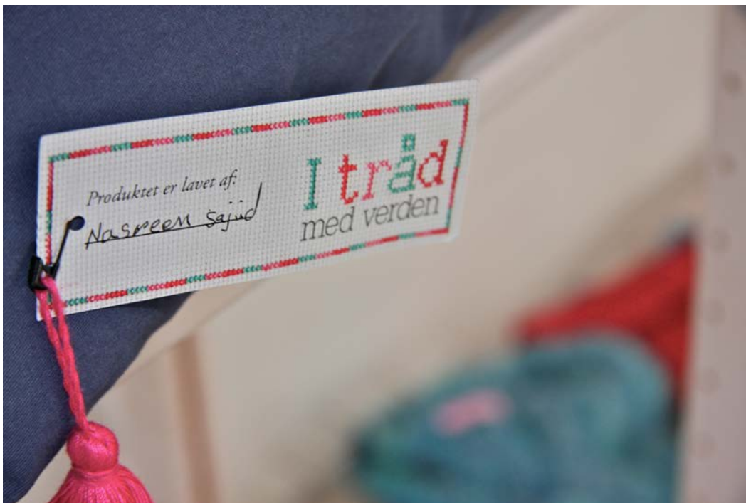
( http://www.mariesideer.dk/wp-content/uploads/2014/02/IMG_7117.jpg )