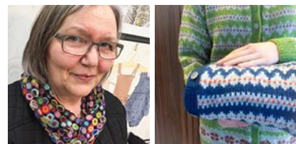
( https://www.instagram.com/p/BCUId0jwScA/ ) ( https://www.instagram.com/p/BCSH4DwwSY_/ )