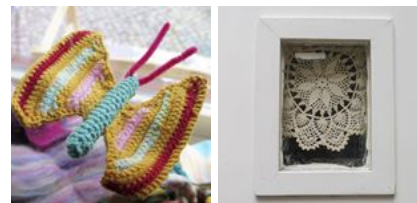
( https://www.instagram.com/p/BCNgMavQSWV/ ) ( https://www.instagram.com/p/BCMrcfjQSB5/ )