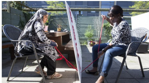
I Tråd Med Verden hjælper udsatte ledige tilbage på arbejdsmarkedet.

Den 26. januar afholder CSR Link den årlige konference Social Entrepreneurs 2017, og her deler I Tråd Med Verden ud af sine gode erfaringer omkring det socialøkonomiske initiativ i Vejleåparken i Ishøj på et seminar, der har fået den meget sigende titel " Succes med socialøkonomi i det boligsociale arbejde".